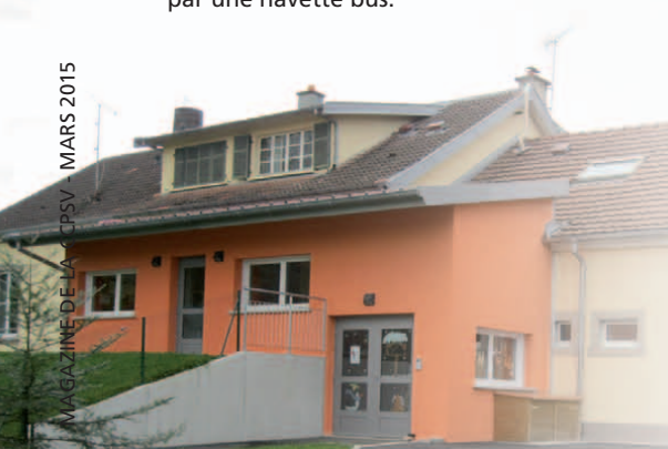
Accueil de loisirs Rougemont-le-Château

• Les projets en cours du Forum jeunes - Délocalisation dans les locaux du foyer rural de Rougemont-le-Château, en semaine, pour se rapprocher du collège. - Conseil Intercommunal Jeunes.