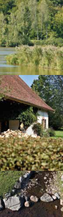
Un des nombreux étangs des Ayeux