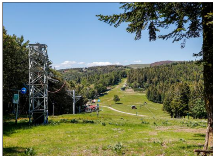
L'emplacement de la future antenne relais en haut de la piste de la Gentiane au Ballon d'Alsace.