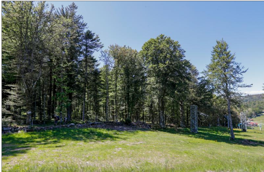
L'antenne-relais devrait être implantée au milieu des arbres, près de l'arrivée du télésiège de la Petite Gentiane.

été ainsi préféré au Château d'eau et à la Tête des Redoutes. Mais le site en question est classé. Une protection qui doit être supprimée pour permettre la réalisation du projet. Comment ? En engageant une procédure de mise en compatibilité du Plan d'occupation des sols (POS) de la commune de Lepuix, sous la direction de la communauté de communes des Vosges du Sud (CCVS), compétente en matière d'urbanisme.